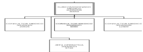
COMISION ESTATAL DE CONCILIACION Y ARBITRAJE MEDICO. ORGANIGRAMA COMPLETO